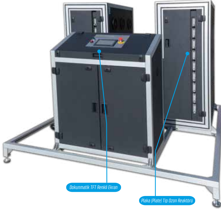
Dokunmatik TFT Renkli Ekran